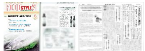
フードスタイル21・健康化学新聞